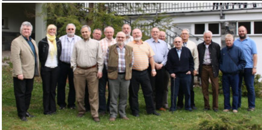
Teilnehmer der Arbeitstagung (v.l.n.r.)

Hauptbeauftragter Amateurfunk in der Stiftung BSW