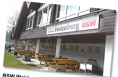
BSW Wald- und Sporthotel Festenburg