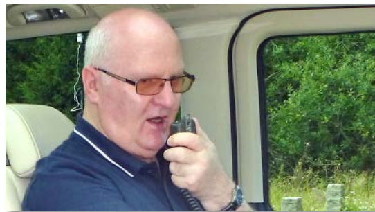
Foto: Peter, DF7AA bei einer seiner unzähligen Funkaktivitäten im Harz

Man denke nur an die häufigen Fahrten auf den Brocken dank der Harzer Schmalspurbahnen.