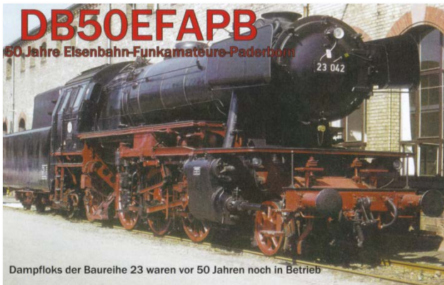
Dampflok der Baureihe 23 waren vor 50 Jahren noch in Betrieb

Sonderstation DB50EFAPB 01. Januar - 31. Dezember 2018