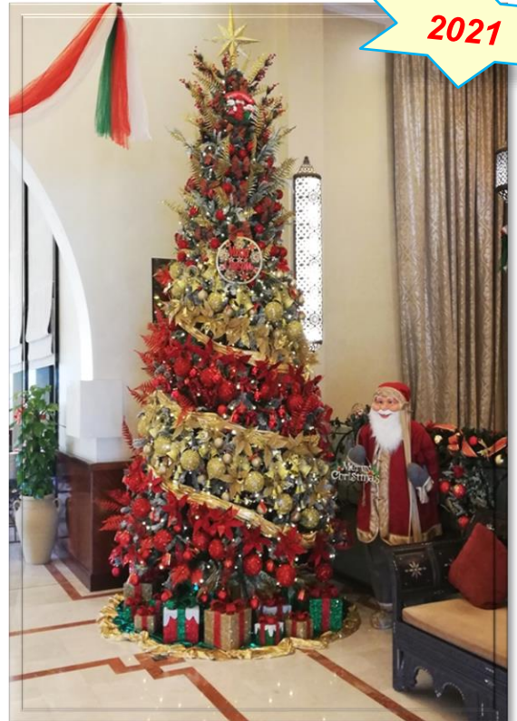
Weihnachtsbaum im „Golden Tulip“ Nizwa (Oman)

In diesem Sinne wünsche ich Euch allen ein frohes Weihnachtsfest im Kreise Eurer Lieben und auf ein gesundes Wiederhören im Jahr 2021.